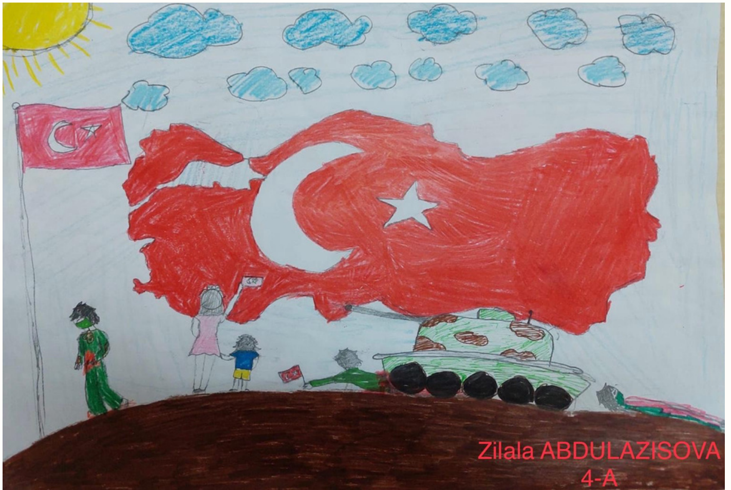
Zilala ABDULAZISOVA 4-A